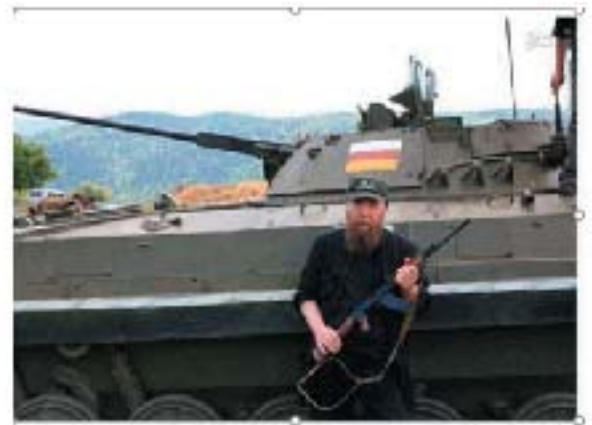
الکساندر دوگین که «فیلسوف و اندیشمند تاریخی» روس می‌نامندش بر تانک تک تیرانداز در بورژوازی ارتش روسیه به اوستیای جنوبی

روزها، بین اکراین و سازماندهی دسته‌های مزدور، به ناحیه مورد اختلاف «اوستیای جنوبی» گرجستان نیز سفر کرد و در کنار نیروهای نظامی و یک واحد موشک انداز بسان یک تک تیرانداز، جلوه گر شد تا فاشیسم را نمایندگی کند. نئوتزاریسم با اشغال بندر کریمه و ستواستوپل اکراین در سال ۲۰۱۳، به وسیله ارتش روس، به این آرزو دست یافت. کاربرد روسیه «جدید»، برای نخستین بار در دهه ۱۹۸۰ از زبان «الکساندر دوگین» شنیده شد و از آن پس، الیگارشی حاکم در روسیه به رهبری «پوتین» این مفهوم را به کار گرفت. دوگین خطرناکترین موجود روی زمین نام نهاده شد.