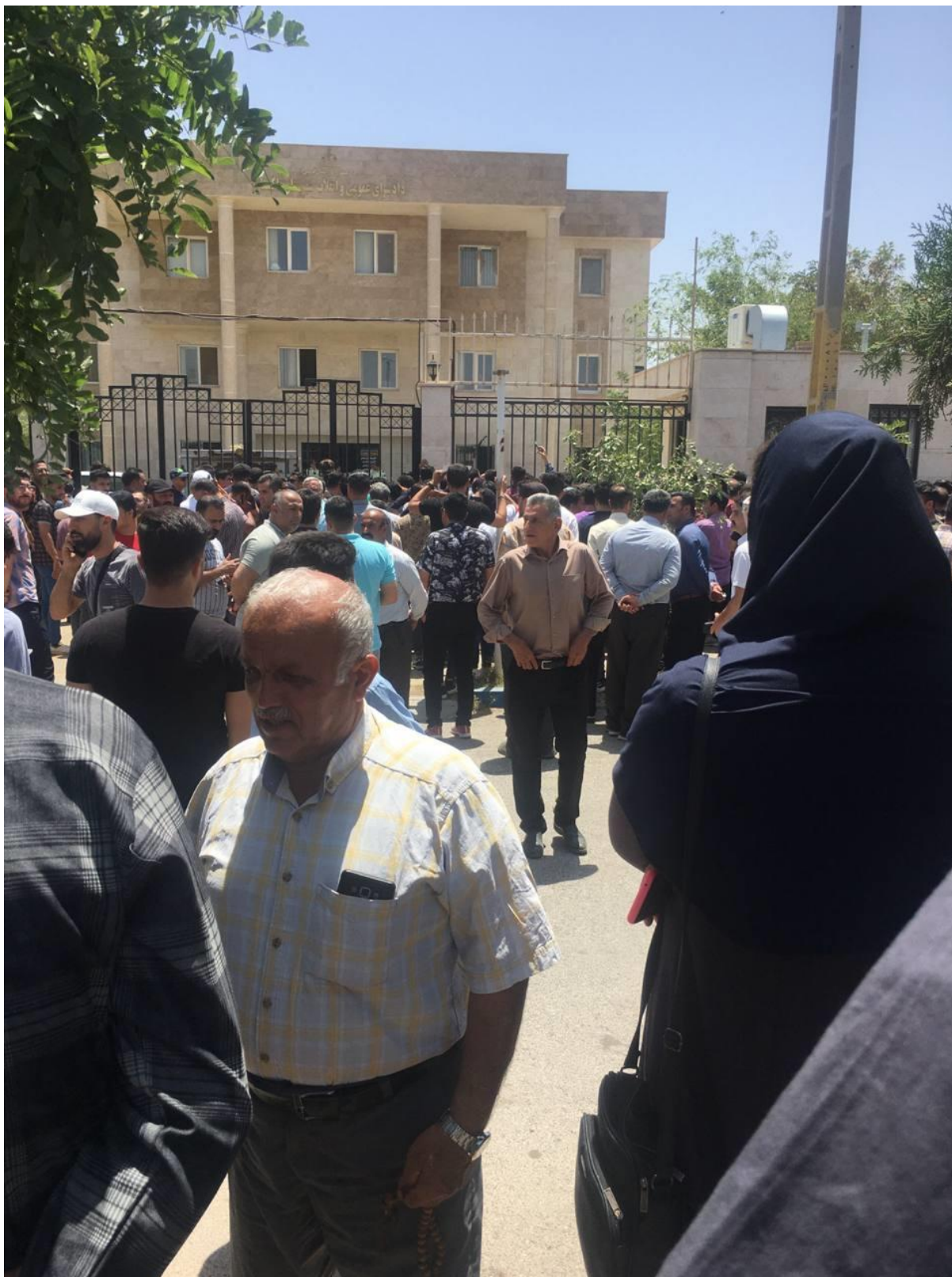
منبع اصلی خبر: کانال اتحادیه آزاد کارگران ایران *بیانیه‌ی کانون نویسندگان ایران درباره‌ی موج سرکوب‌های اخیر گور آزادی‌خواهان، گور آزادی‌خواهی نخواهد شد!